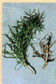
KIKUYO Pennisetum clandestinum

Por otra parte su bajo costo (en el caso de la alfalfa 5 $us/ha), hace posible su uso masivo.