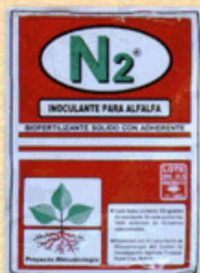
Inoculante N 2 para alfalfa (ventas en Cochabamba: SEFO).

Un inoculante con bacterias específicas de Rhizobium permitirá a la leguminosa captar nitrógeno atmosférico para beneficio de la planta y para fijarlo en el suelo para los cultivos siguientes.