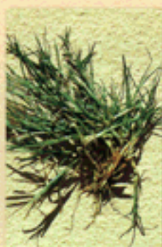
GRAMA Cynodon dactylon

Elimina de tus campos de alfalfa estas dos malezas porque son muy agresivas y acortan la vida de tu alfalfar.