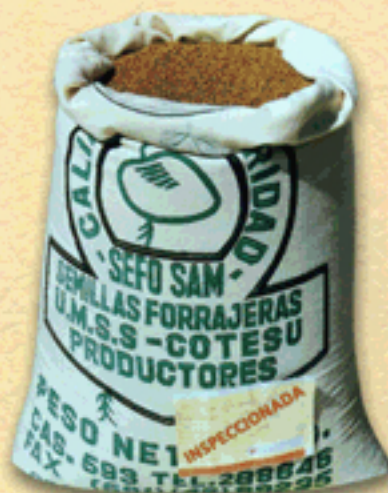
UTILIZA SEMILLA DE BUENA CALIDAD Y GARANTIZADA

Elimina de tus campos de alfalfa estas dos malezas porque son muy agresivas y acortan la vida de tu alfalfar.